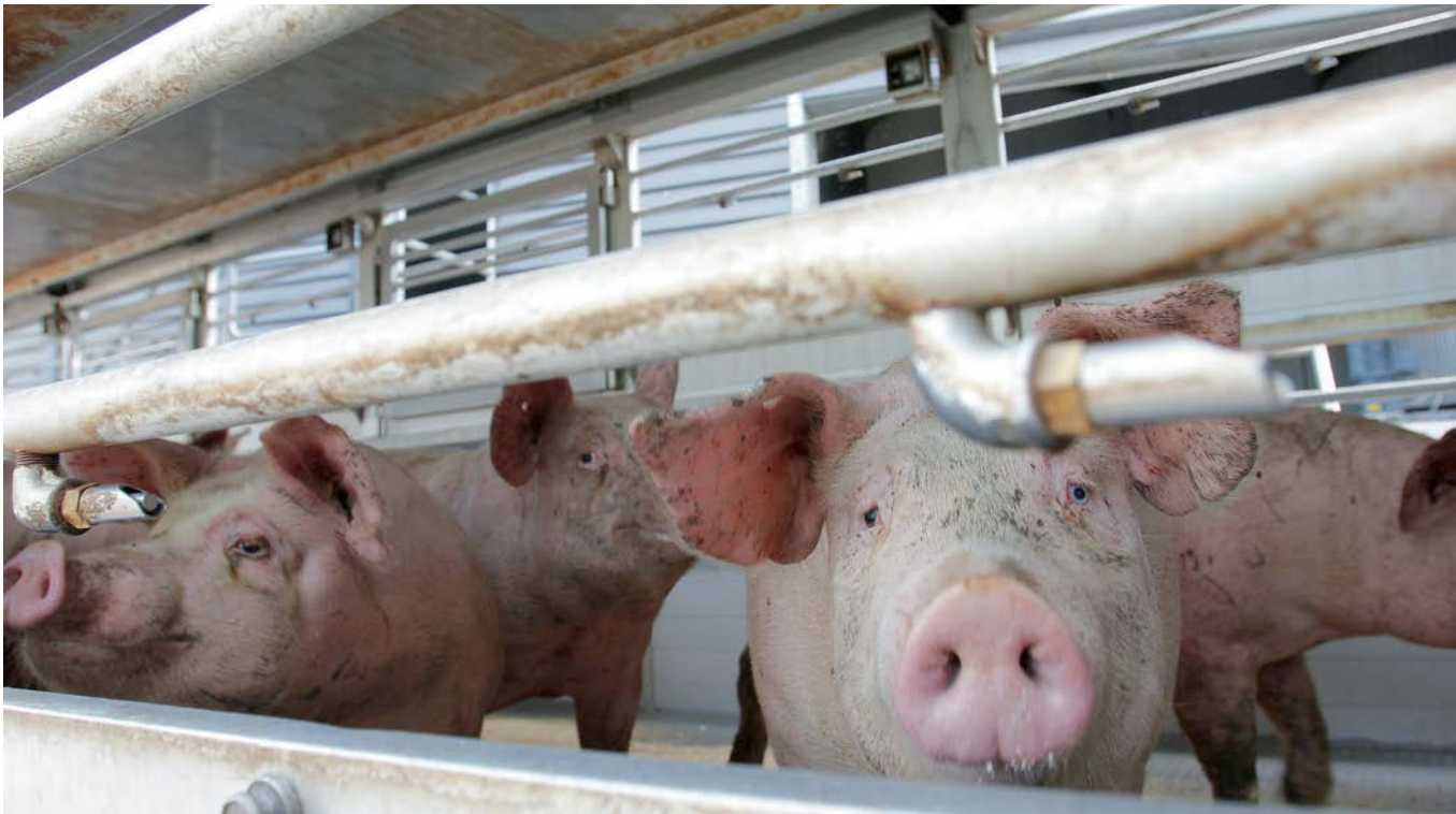
Ook worden chauffeurs wel door omstanders gefilmd als ze varkens of biggen staan te laden.

wel door rechters geaccepteerd. In België zijn dergelijke illegaal verkregen beelden recentelijk bij één zaak niet door de rechter geaccepteerd. „Daar willen we in Nederland ook naartoe”, aldus Lodders.